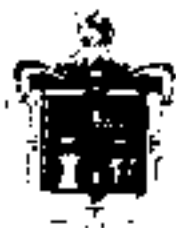
Jorge Guamán Coronel PREFECTO PROVINCIAL DE COTOPAXI